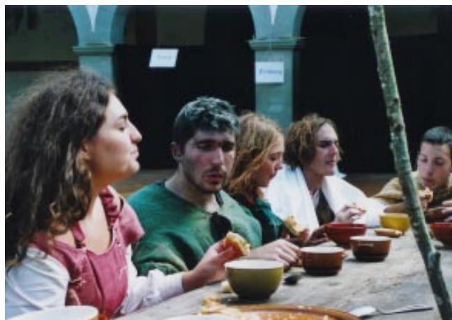
Les Longues Fourchettes aux Rencontres médiévales de Fribourg en 2003

Si un compliment nous réjouit particulièrement, c'est : « On voit que vous avez du plaisir à jouer ensemble. ». Car, au-delà