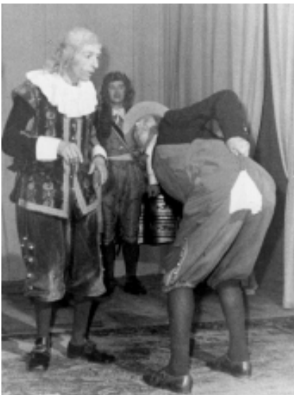
L'avare de Molière : un classique pour les vingt ans de la troupe en 1965

Etonnamment, dès les débuts, le répertoire de la troupe ne se cantonne pas dans les comédies de boulevard ou les pièces policières. Des noms prestigieux parsèment ainsi la liste des auteurs joués par les Compagnons du Coteau : Molière ( L'avare – 1965, Les fourberies de Scapin – 1956), Jules Romains ( Volpone – 1955), Musset ( Un caprice – 1968), Tchekhov ( Oncle Vanja – 1970), Gorki ( Les petits bourgeois – 1977), ou encore Max Frisch ( M. Bonhomme et les incendiaires – 1975). Un éclectisme à souligner, certainement favorisé par la collaboration avec des metteurs en scène professionnels, tels