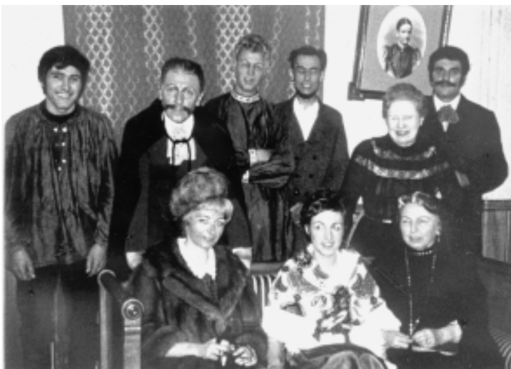
Uncle Vania de Tchekhov (1970) dans une mise en scène de Nanine Rousseau