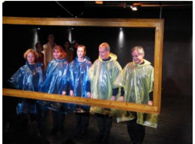
Tarado Théâtre dans Théâtre sans animaux de Jean-Michel Ribes (2004)