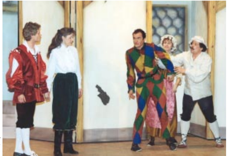
Arlequin, serviteur de deux maîtres (Goldoni - 1990)