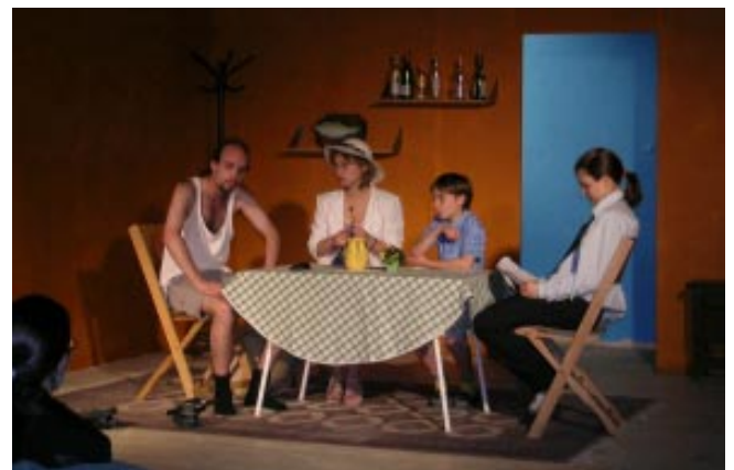
Le Théâtre Bulle dans Les autres de Jean-Claude Grumberg (2005)