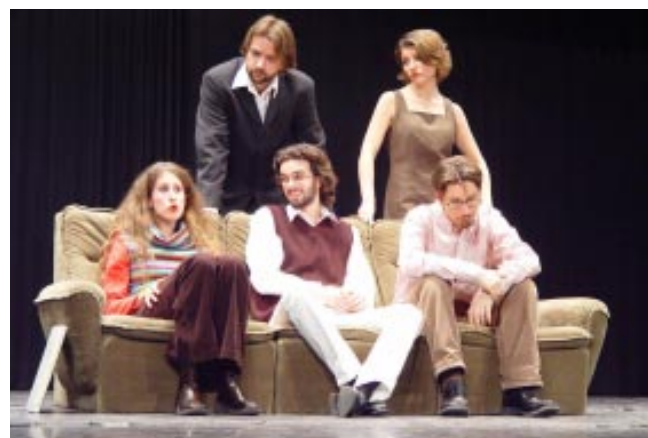
La Cie AOC dans Théâtre sans animaux de Jean-Michel Ribes (2004)